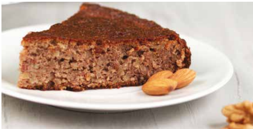
Για 10 μερίδες