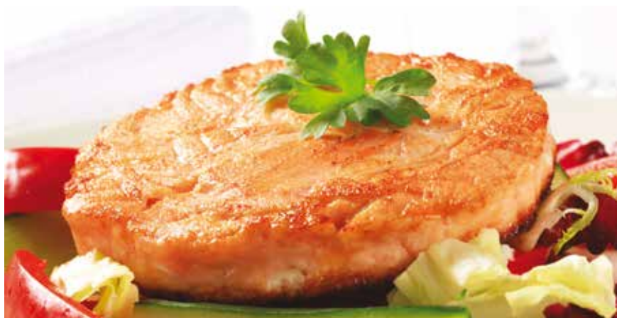
Για 4 μερίδες