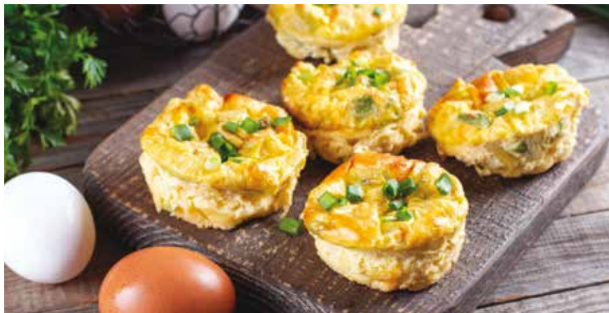
Για 6 μάφινς