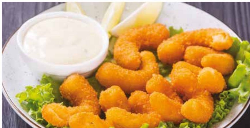
Για 4 μερίδες