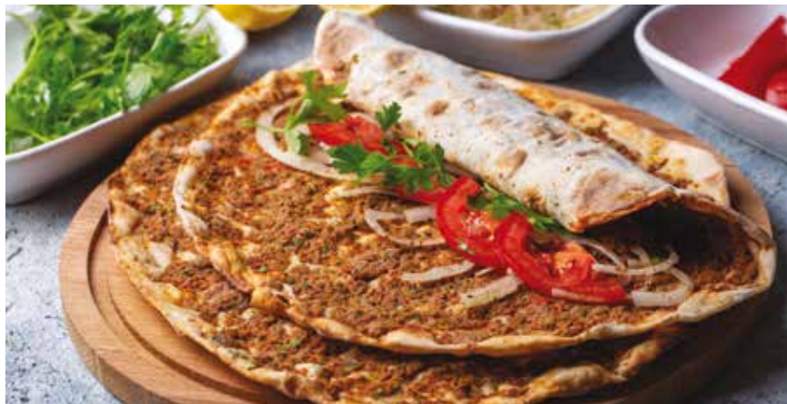
Για 4 λαχματζούν