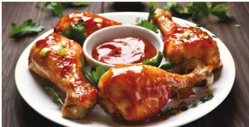
Για 4 μερίδες