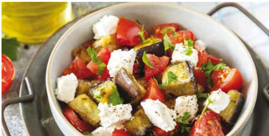
Για 6 μερίδες