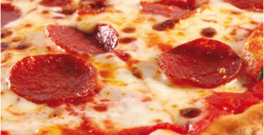
Για 4 μερίδες