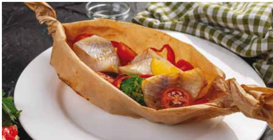
Για 4 μερίδες