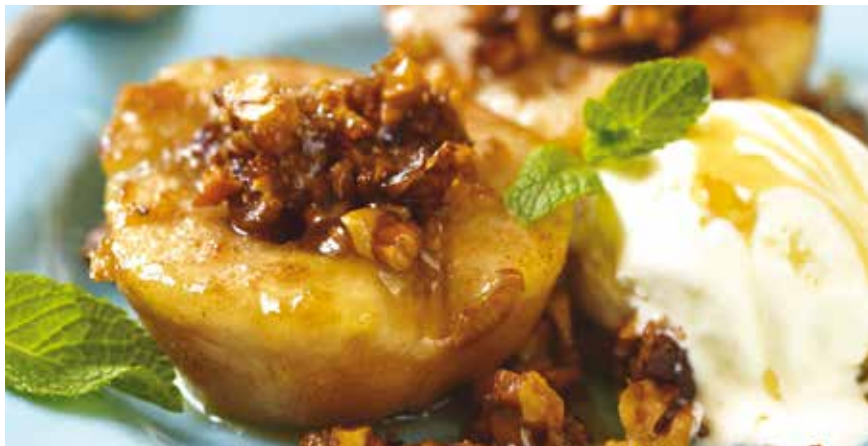
Για 4 μερίδες