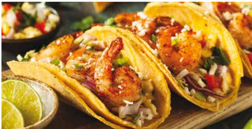
Για 8 τάκος