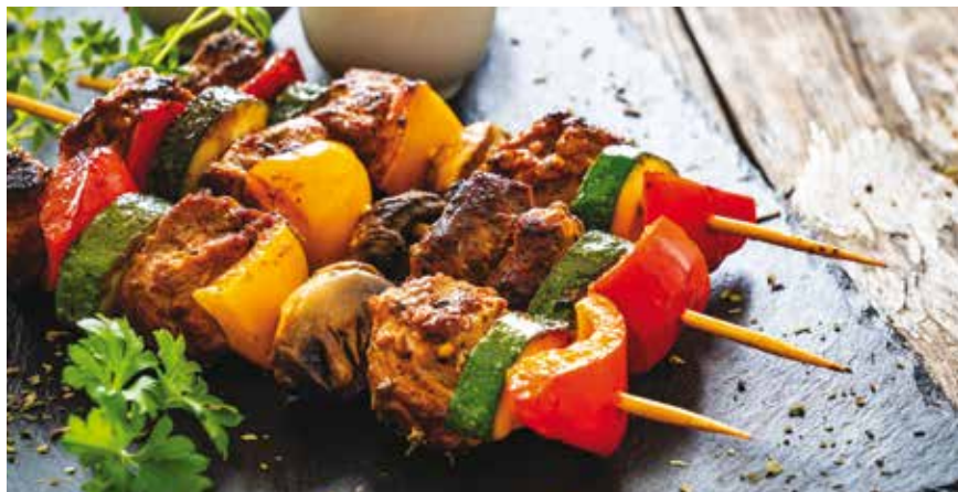
Για 4 μερίδες