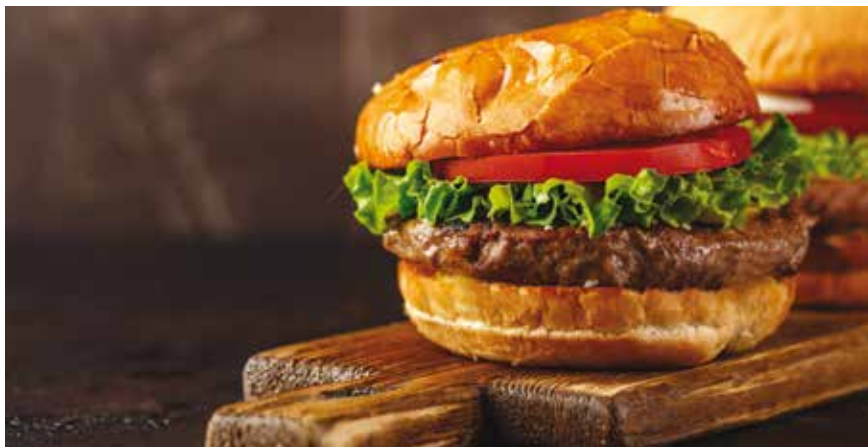
Για 4 μπέργκερ