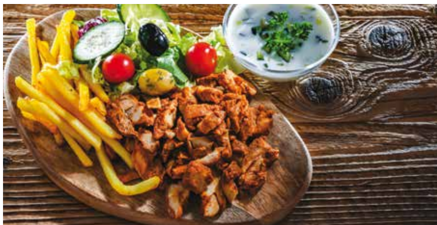
Για 4 μερίδες