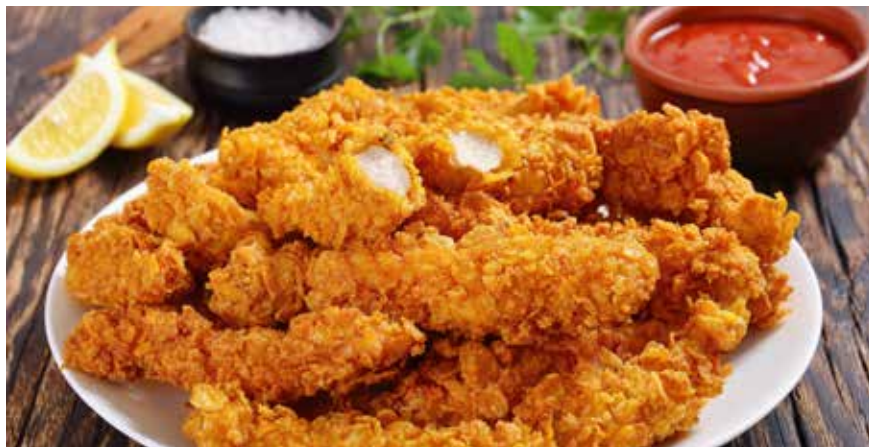
Για 4 μερίδες