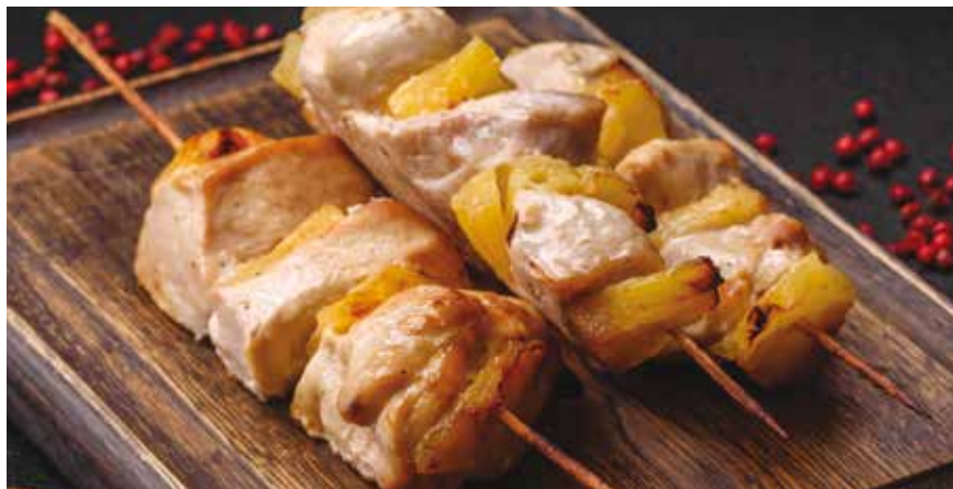
Για 6 σουβλάκια