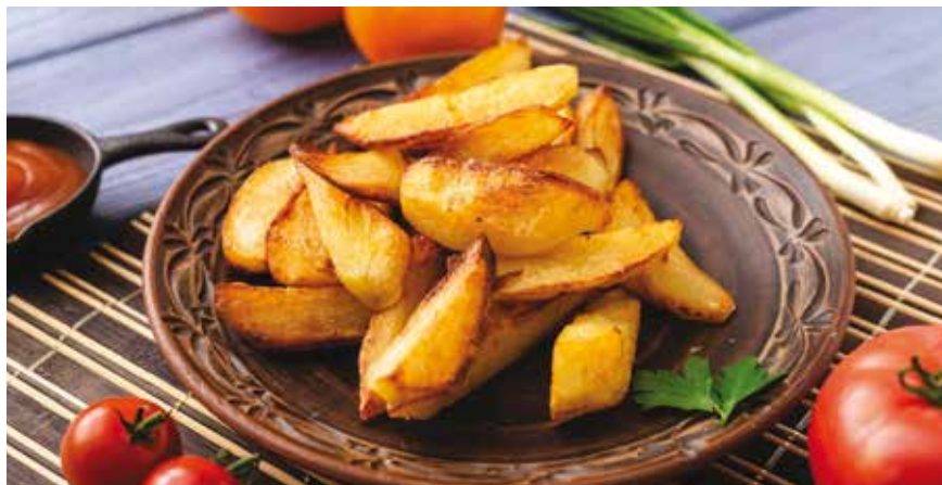
Για 4 μερίδες