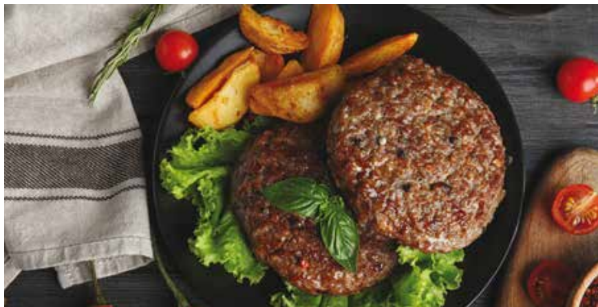
Για 4 μερίδες