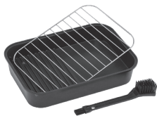
Σχάρα & Βούρτσα καθαρισμού